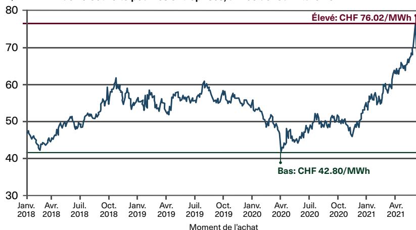
CHF/MWh Prix de l'électricité pour les entreprises, année de fourniture 2022

En l'espace de trois ans et demi, les prix annuels facturés aux clients pour la livraison en 2022 ont varié entre environ CHF 43/MWh (prix le plus bas) et CHF 76/MWh (prix le plus