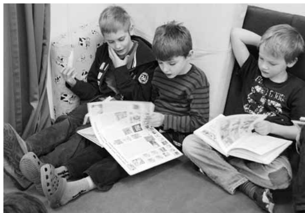
Die Schulbibliotheken entwickeln sich von einem reinen Ausleihbetrieb zu einem Lern- und Betreuungsort.

Die Zürcher Schulen erhalten ein neues Bibliothekssystem. Nach dem Abschluss der Evaluation im Berichtsjahr wird 2012 mit der Umrüstung in den Schulen begonnen. Für einen Testbetrieb wird zunächst die Schule Auzelg mit dem neuen System ausgerüstet. Das automatisierte Bucherfassungssystem bringt mit seiner Anbindung an einen zentralen Katalog für das Bibliotheksteam eine grosse Entlastung. Die Schülerinnen und Schüler werden in Zukunft sowohl von jeder Computerstation in der Schule als auch von zu Hause aus auf den Bibliothekskatalog und auf ihr Konto zugreifen können. Gleichzeitig entwickeln sich die Schulbibliotheken von einem reinen Ausleihbetrieb zu einem Lern- und Betreuungsort, an dem, neben dem Lesen, auch das Schreiben und der Umgang mit neuen Medien gefördert werden.