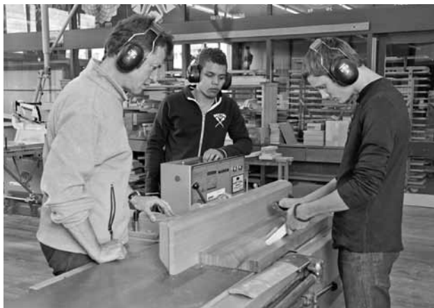
Das Berufsvorbereitungsjahr soll jungen Menschen zu einer Anschlusslösung verhelfen.

Die verschiedenen Angebote des Berufsvorbereitungsjahrs weisen unterschiedliche Schwerpunkte auf. Im Zentrum stehen die handwerkliche Praxis und die Allgemeinbildung. Ziel des Berufsvorbereitungsjahrs ist es, möglichst vielen jungen Menschen zu einer beruflichen Anschlusslösung zu verhelfen. Nebst dem Schliessen schulfachlicher Lücken und dem Vertiefen und Aufbauen von neuem Wissen spielt das Aneignen von ersten beruflichen Fähigkeiten, intern in Ateliers oder teilweise in externen Praktika, eine wichtige Rolle.