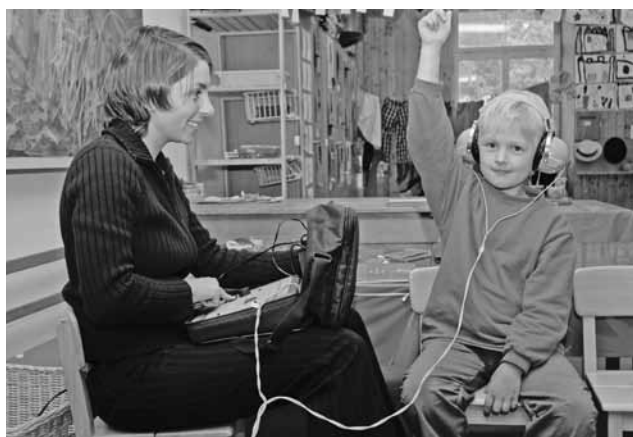
Gehörprüfung (Audiometrie) bei der Schulärztlichen Vorsorgeuntersuchung.

Der Schulärztliche Dienst stand den Schulen weiterhin, vor allem bei Kindern mit besonderen medizinisch oder entwicklungs-pädiatrisch begründeten Bedürfnissen, in der Umsetzung der Schulreformen und der Erschaffung einer «integrierenden Schule für alle» zur Seite. Im Rahmen der Dachstrategie Gesundheitsförderung und Prävention unterstützten die Ernährungsberaterinnen des SAD die Horte bei der Umsetzung der städtischen Ernährungsrichtlinien und individuell bei Kindern mit medizinisch begründeten Ernährungsbesonderheiten (z.B. Nahrungsmittelallergien, Stoffwechselkrankheiten). Neben den Bewegungsförderungsangeboten der Schulgesundheitsdienste z.B. im Projekt Purzelbaum hat sich der SAD der Erneuerung der indizierten Bewegungsangebote gewidmet. Davon profitieren Kinder, die vor allem bei den schulärztlichen Vorsorgeuntersuchungen bezüglich Bewegungsmangel, Übergewicht oder Rückenproblemen auffallen. Die neuen Angebote (ab Schuljahr 2011/12) ersetzen frühere Angebote, wie z.B. das Haltungsturnen.