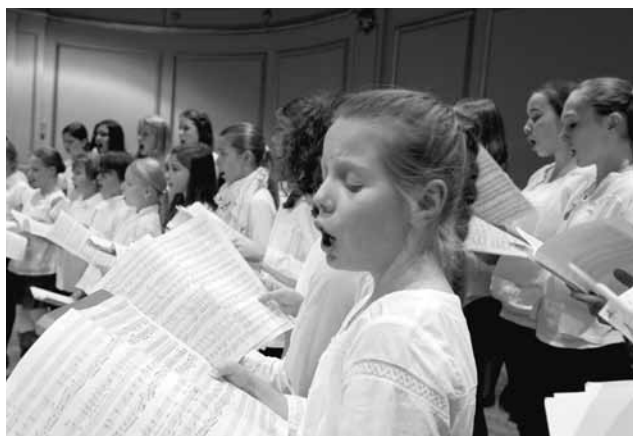
Die Konzerte der MKZ-Schülerinnen und -Schüler bereichern Zürichs Kulturleben.

Mit der Zustimmung des Gemeinderats fand das Projekt «Monteverdi» im Sommer 2011 seinen Abschluss. Die JSZ und ZKKJ treten seit dem 1. September 2011 vereint unter dem neuen Namen Musikschule Konservatorium Zürich auf. Damit steht Schülerinnen und Schülern aller Altersstufen ein vielfältiges Unterrichtsangebot in Klassik, Pop, Rock und Jazz sowie Tanz und Theater offen. Die Zusammenführung der beiden Schulen mit zuvor eigenständigen Kulturen wurde auch nach dem offiziellen Abschluss des Projekts «Monteverdi» fortgesetzt und bedarf auch im kommenden Berichtsjahr grosser Aufmerksamkeit.