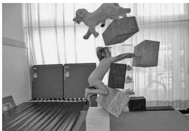
Rund 1300 Kinder besuchten im Berichtsjahr die Psychomotorik-Therapie.

Im Schuljahr 2010/11 besuchten gesamtstädtisch rund 1000 Kinder die Psychomotorik-Therapie oder erhielten innerhalb der Klasse eine psychomotorische Förderung. Daneben wurden in Zusammenarbeit mit den Lehrpersonen 300 kleine oder grössere Präventionsprojekte in den Bereichen Grobmotorik und Grafo-/Feinmotorik durchgeführt. Die Besuche der Schulkommissionsmitglieder verliefen durchwegs erfreulich. Das grosse Engagement und die hohe Fachkompetenz der Therapeutinnen und Therapeuten wurden sehr gelobt.