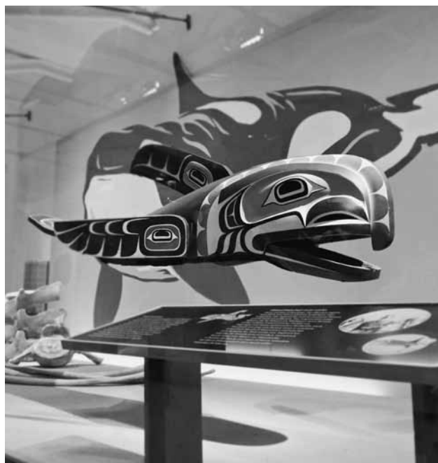
Die Sonderausstellung «Von Lebertran bis Totemtier» stellte die Beziehung von Mensch und Tier in den Kulturen am Polarkreis ins Zentrum.