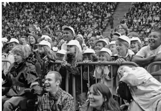
Über 2000 Hortkinder waren von der grossen Jubiläumsparty 125 Jahre Hort im Stadion Letzigrund begeistert.

2011 wurde das Jubiläum «125 Jahre Stadtzürcher Hort» gefeiert. Der Auftakt fand am 8. März 2011 mit einem historischen Mittagessen in der Schule Kornhaus statt. Der Vorsteher schenkte den Kindern Suppe aus, die zuvor mit einem Pferdefuhrwerk durch «Menu and More» angeliefert worden war. Ein Hortfilm, das Jubiläumslied «Mir sind im Hort», die Website www.stadt-zuerich.ch/125-jahre-hort sowie zahlreiche