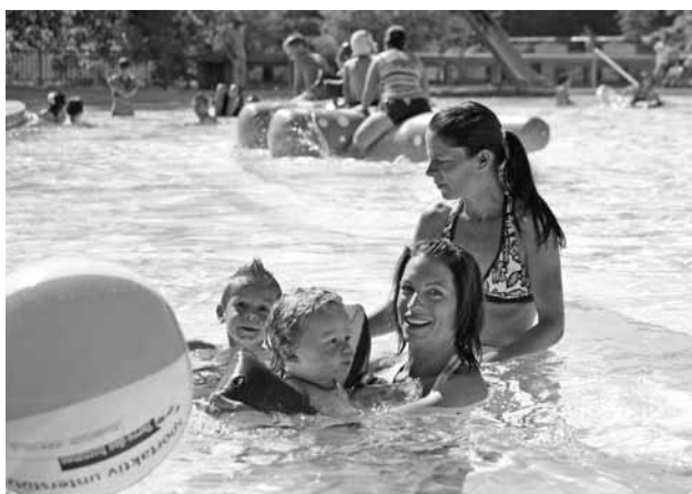
Die Städtischen Badeanlagen zählten im Berichtsjahr 2,35 Mio. Eintritte.

Zürchs Hallen- und Freibäder zählten im Kalenderjahr 2011 rund 2,35 Mio. Eintritte (einschliesslich Eintritten in die durch private Trägerschaften geführten städtischen Bäder, aber ohne Eintritte in die Schulschwimmanlagen). Das entspricht im Vergleich zum Vorjahr einer Abnahme um 1 %, die insbesondere auf die Schliessung des Hallenbads City (Umbau während zwei Jahren) zurückzuführen ist. Trotz erweiterter Öffnungszeiten in den übrigen Hallenbädern konnten nicht alle City-Gäste in den städtischen Anlagen gehalten werden. Im Vergleich zu 2009 (letztmals City ganzjährig in Betrieb) musste ein Rückgang um rund 175 000 Eintritte hingenommen werden, was etwa 45 % der City-Jahresfrequenz entspricht.