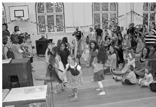
Die Schule Altstetterstrasse feierte zu ihrem 100-Jahr-Jubiläum ein buntes Fest.

Die Auswirkungen der städtebaulichen Veränderungen wurden deutlich spürbar. Wichtig für die Kreisschulpflege Letzi ist eine sorgfältige Planung, die mit den Entwicklungen Schritt hält. Die wachsende Bevölkerung verlangt einerseits mehr Schulraum, andererseits einen nochmals verstärkten Ausbau der