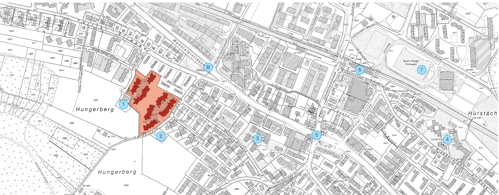
Bewilligung Geomatik + Vermessung Stadt Zürich 1. März 2005